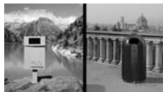
Claude Bechtold, CH riverboom.com