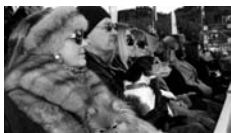
Martin Parr, GB martinparr.com