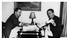
Michel Campeau, CA campeauphoto.com