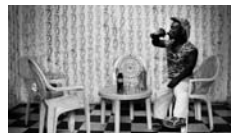
Nicola Lo Calzo, I