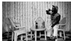
Nicola Lo Calzo, I