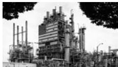
Mitch Epstein, USA mitche Epstein.net