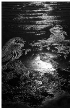
Lucien Clergue, FR anneclergue.fr