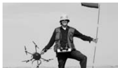
Raphaël Dallaporta, CH raphaeldallaporta.com